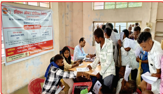
Assessment by the CRC Ahmedabad team at the equipment assistance camp organized by IOCL.