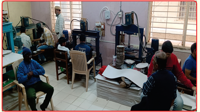
Paper Dish Making Unit Vocational Training cum Production Center