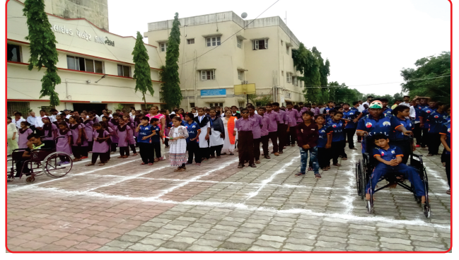
Flag Hoisting ceremony - Independence Day