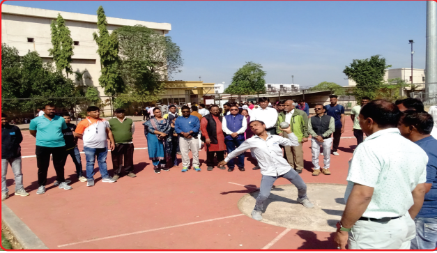
SP Khel Mahakumbh - Shot Put