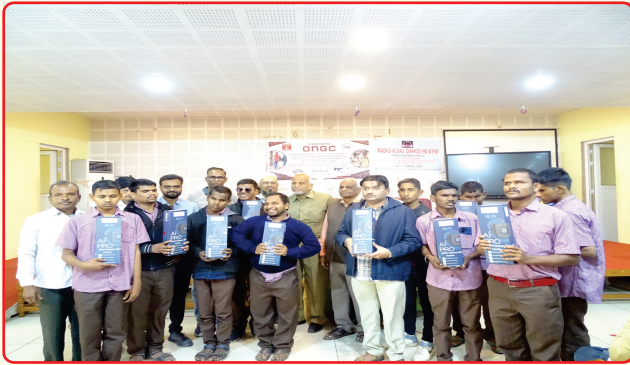
Distribution of smart glasses to visually impaired Persons