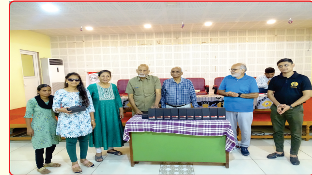
Smart Glass distribution for the Visually Impaired persons