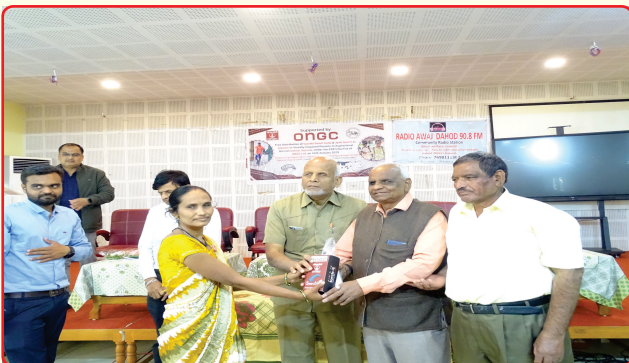
Distribution camp of Jyoti and Sarathi devices to Persons with VI