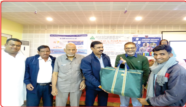
Self-employment kits were distributed to differently-abled beneficiaries by the Mafatalal Group through the hands of the Municipality President