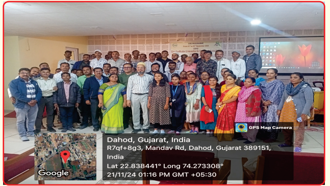
Cre Porgram National level at BWC Campus