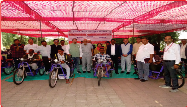
Under the assistive aid program, motorized tricycles were provided to Divyang beneficiaries of Dahod district by IOCL.