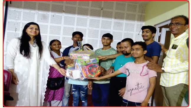
Educational Game to Sp School Children by DDO's Wife Dahod