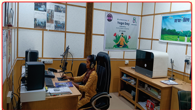
Community Radio 90.80 F.M. Radio Awaj BWC Dahod