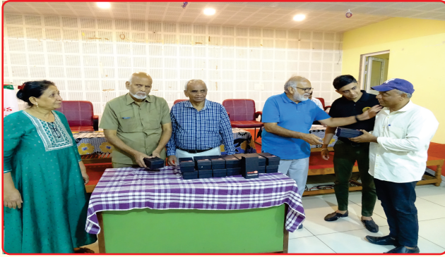
Smart glass distribution to visually Impaired Persons