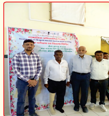
Artificial limb distribution camp organized by ALIMCO for persons with disabilities in Dahod dist.