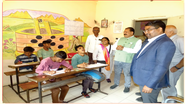
Sp. School visit by Dahod Collector