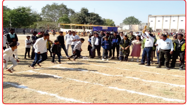
SP Khel Mahakumbh - 100 M Run