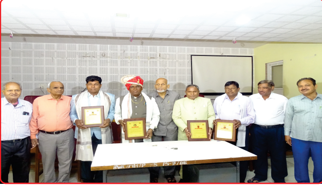
Retired Sp Teachers Honoured