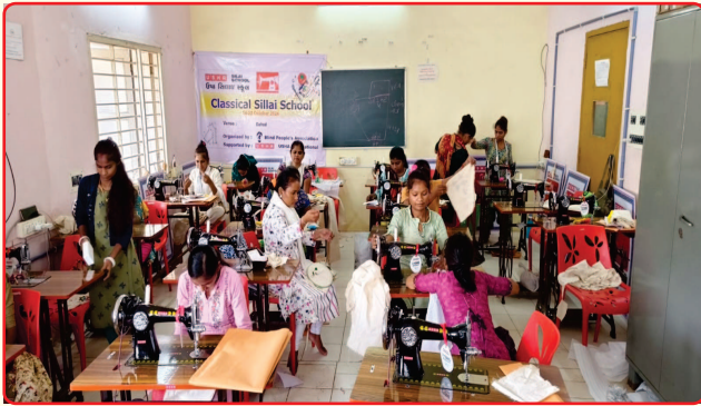
Tailoring Training sessions provided to differently-abled women by USHA company