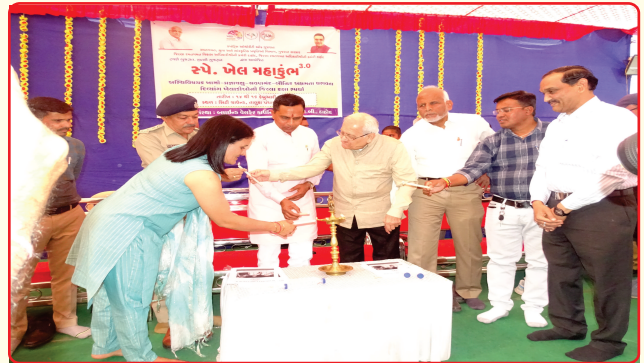
Inauguration of Sp Khel Mahakumbh Dahod Dist Tournament