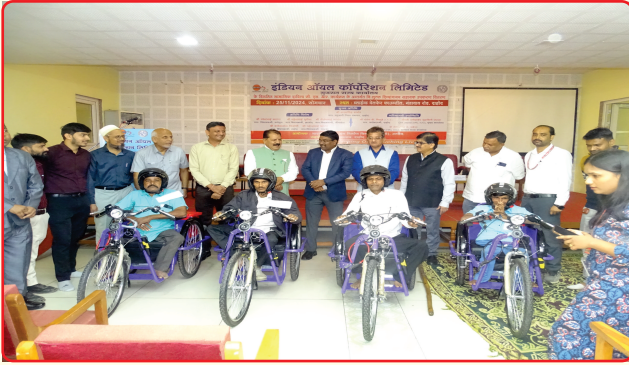
Under the assistive aid program, motorized tricycles were provided to Divyang beneficiaries of Dahod district by IOCL.