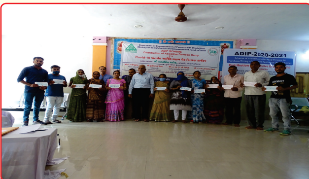
Cheque Distribution under Covid 19 by Give India & ADIP Aids and Appliances Distribution, Lunawada