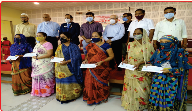
Cheque Distribution under Covid 19 Relief by Give India Dahod