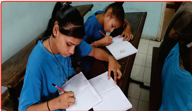
Students with Hearing Impairment in class room