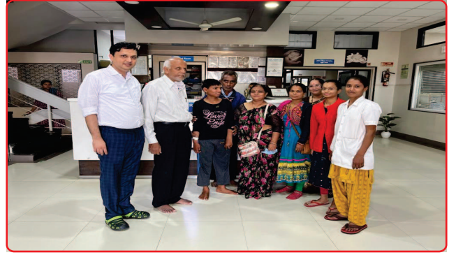
New life of a special child after successful operation