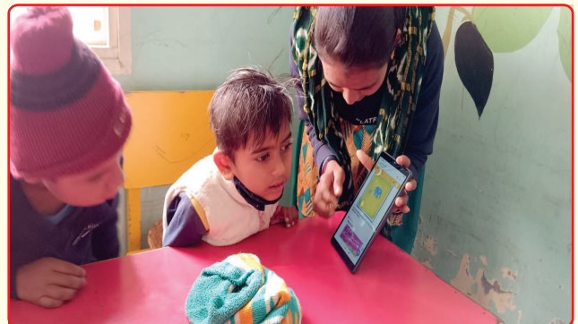
Teaching through Tablet