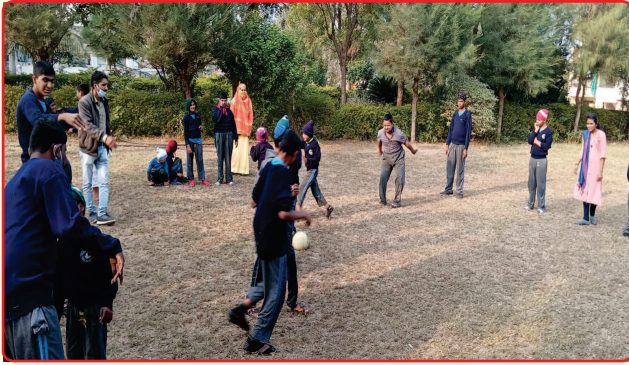
Special Children playing in garden