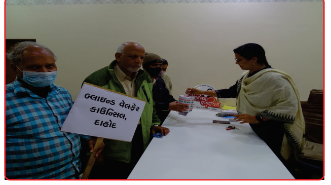
Fund raising on 3rd Dec World Disability Day