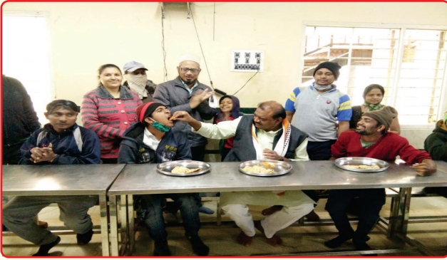
Birthday Celebration of MP Dahod with Special Children