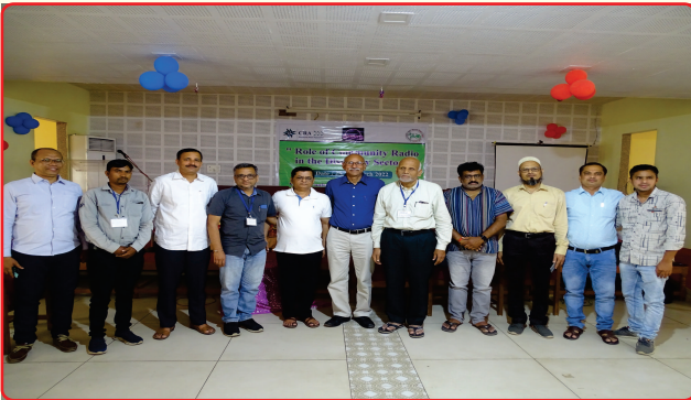
Seminar on Role of Community Radio in Disability Sector