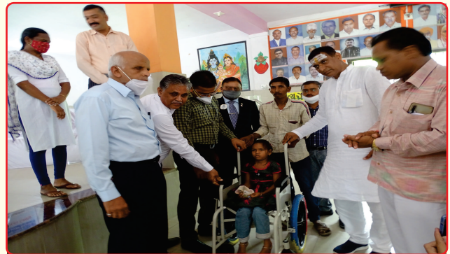
ADIP Aids and Appliances Distribution