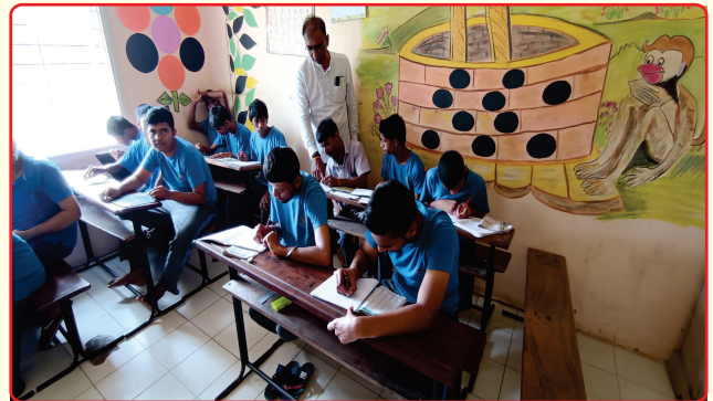
Special Children studying in class room