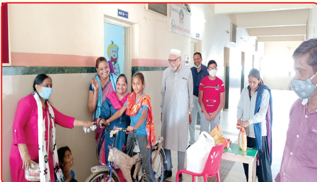
Birthday gift of Bicycle by a Student