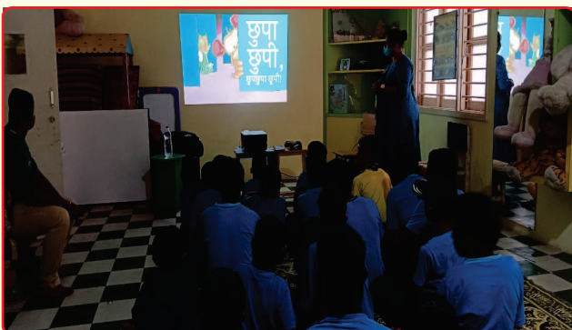
Teaching through projector