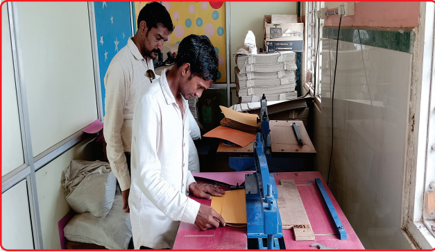
File Making Unit