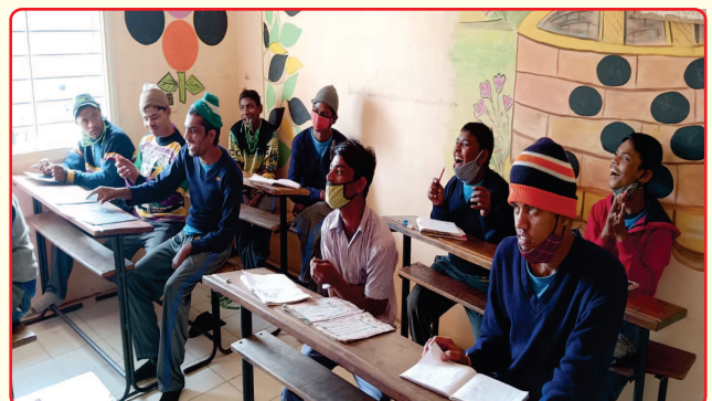
Class room activity