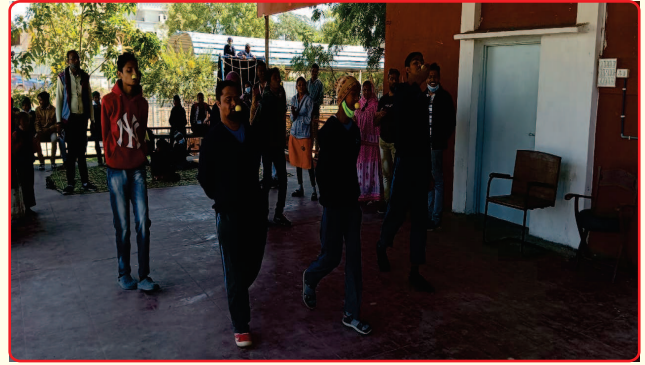
Special Children at picnic