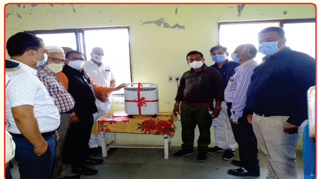
Oxygen Concentration Machines for needy during Pandemic