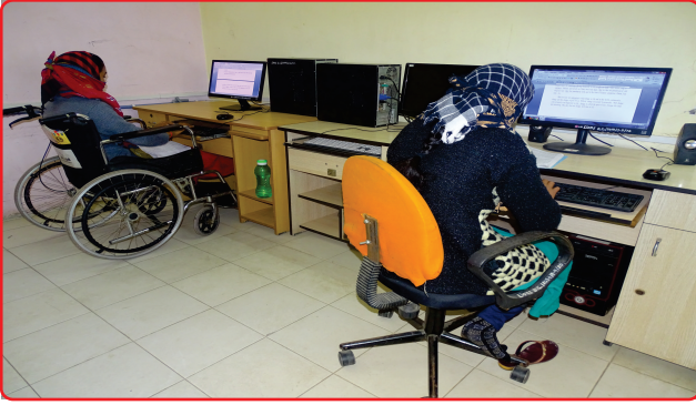
Computer Training Center