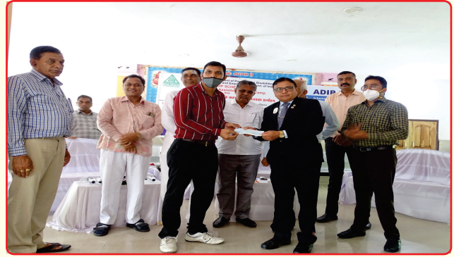
Cheque Distribution under Covid 19 by Give India & ADIP Aids and Appliances Distribution, Lunawada