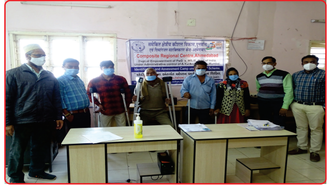
Distribution of Aids & Appliances