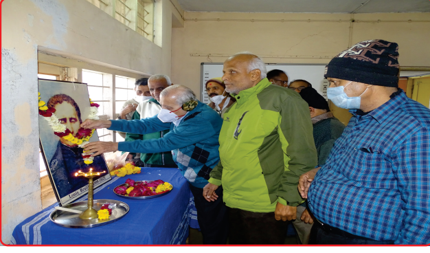
Celebration of Birth anniversary of Louis Braille