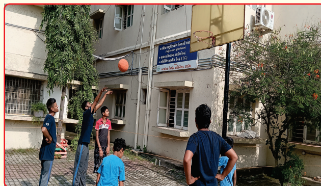
Basket ball training to the special athletes