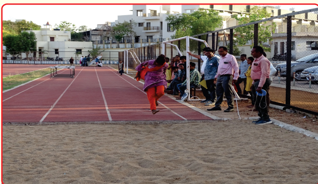
Long jump khel maha kumbh PMS