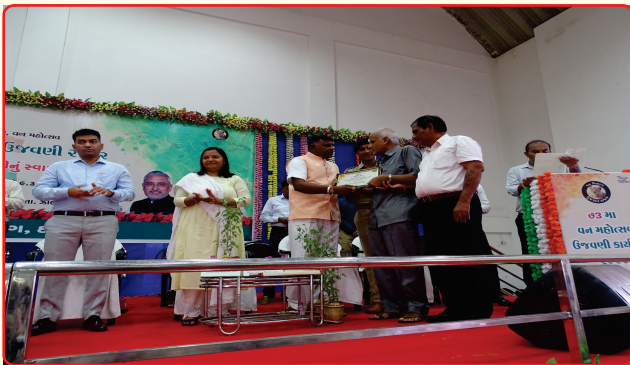
Van Utsav Sanman Karyakram Appreciation BWC