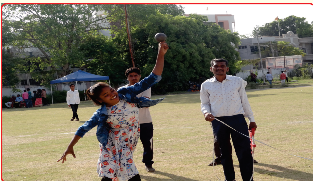
Khel mahakumbh Dahod