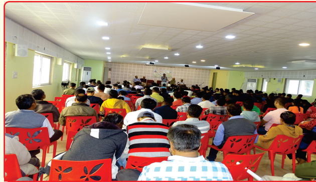
3rd Dec World disabled day Public awareness program