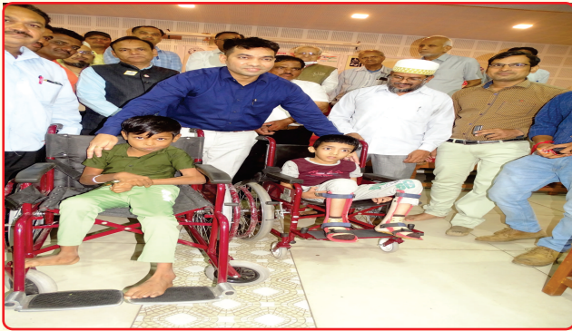
Aids & appliances distribution to the needy