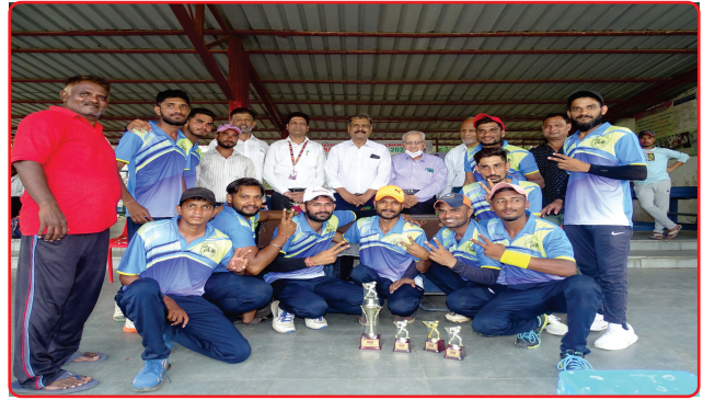
Winners of the Triangular cricket for the persons with Loco motor disability