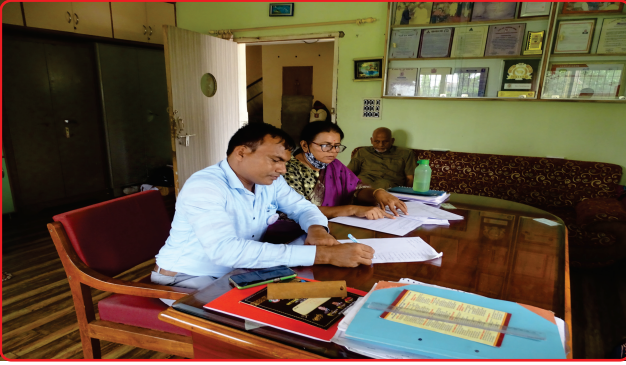
D.Ed Se MR Inspection visit