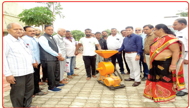
Flour mill distribution to the disabled