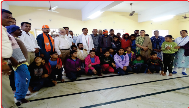
Visit of the MLA Dahod