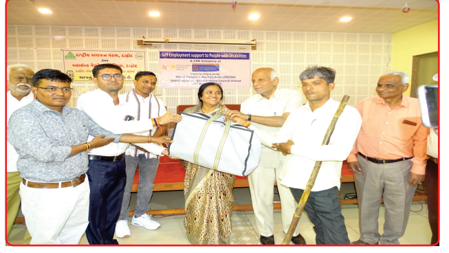
Self employment kits distribution supported by BPA Ahmedabad