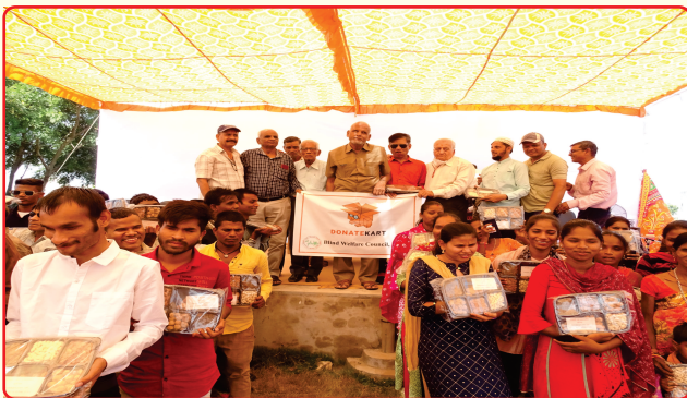
Dry fruits distribution to the viusally impaired supported by Donatekart