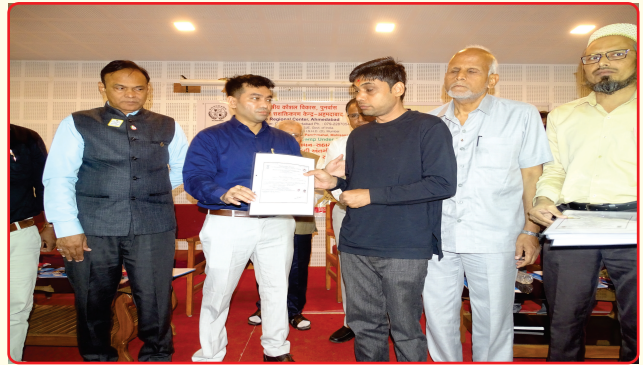
Legal guardianship certificate distribution