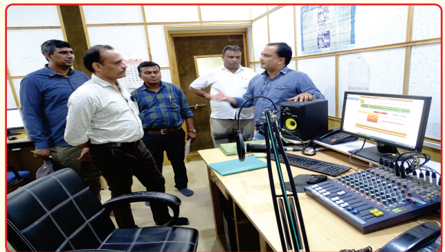
Visit of the Deputy Director Gandhinagar