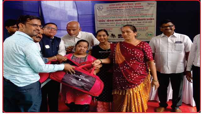
Aids and appliances distribution Lunawada