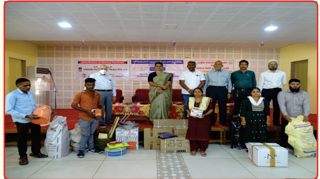
Self employment kits distribution to the persons with disabilities