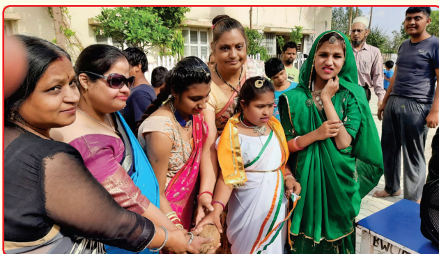
Down syndrome day celebration