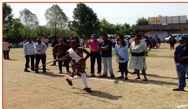
Khel maha kumbh Mahisagar