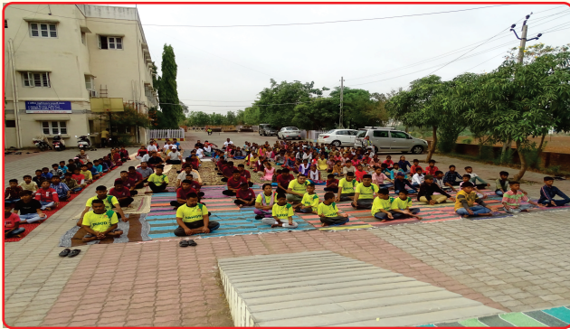
Yoga Day celebration