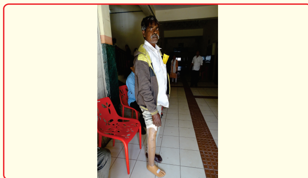
Artificial limbs made and distributed