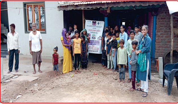
Health awareness program by Radio Awaj Dahod